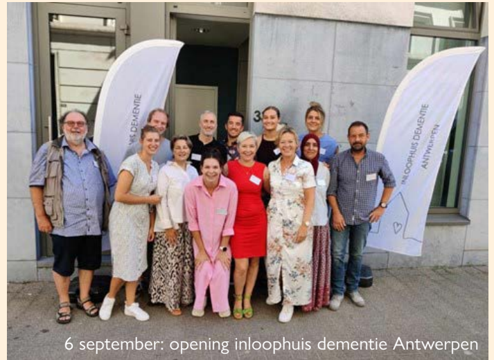
6 september: opening inloophuis dementie Antwerpen

Daarnaast wil het inloophuis ook een laagdrempelige opstap zijn naar de geheugenkliniek. Uit onderzoek blijkt dat mensen die te maken krijgen met geheugenproblemen, niet snel genoeg de weg hiernaartoe vinden en dat ze na diagnose niet gemakkelijk het juiste zorgaanbod vinden. Met een snelle diagnose en bege-