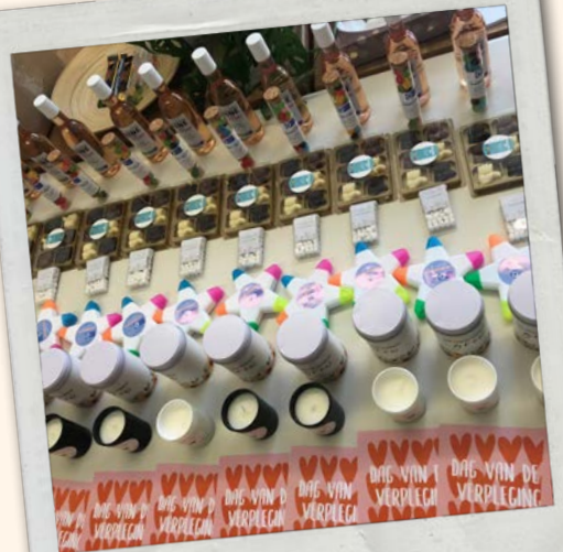
Dag van de VP

Heerlijk om (tussen de buien door) 's middags weer in onze grote tuin te kunnen buiten zitten tijdens de lunch!